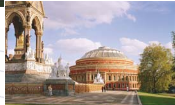
2 | An Prince Albert erinnert das Denkmal gegenüber der Halle.