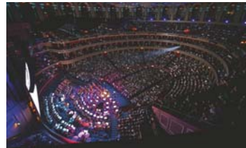
4 | Volles Haus in der Royal Albert Hall.