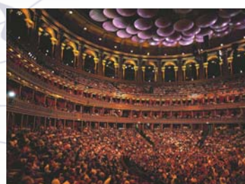
5 | Die Ufos unter der Kuppel dienen der Akustik.